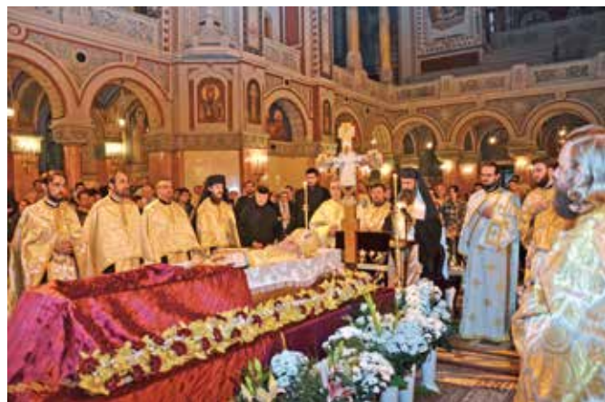
Mesajul de condoleanțe al Înaltpreasfințitului Arhiepiscop Irineu al Alba Iuliei

Arhiepiscop al Episcopiei Ortodoxe Române din America